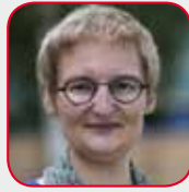
INGE VAN HOVE